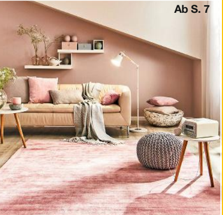
Ab S. 7

Nr. 4/2022 Deutschland 2,90 € | Österreich 3,20 € Schweiz 5,10 SFR | Benelux 3,30 € | Frankreich 3,30 € Italien 3,30 € | Slowenien 3,30 € | Spanien 3,30 €