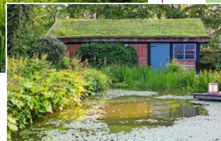
Von Wintergarten und Terrasse aus blickt man direkt auf den Teich. Schwimmblattpflanzen wie die Seekannen sorgen für eine gute Wasserqualität. Das Dach der Garage (kleines Foto) ist begrünt

Terrasse und Wege sind aus regionalen Materialien wie Klinker, versiegelte Pflasterflächen gibt es nicht, der Teich ist ausschließlich mit Lehm abgedichtet. Cordula Hamann erhielt den alten Baumbestand, sodass sich große lichtdurchflutete Staudenflächen, ergänzt von Wildgehölzen wie Schlehen und Hecht-Rose, mit schattigen Bereichen abwechseln. Sie sorgen so für üppige Vielfalt inmitten zeitloser Schönheit.