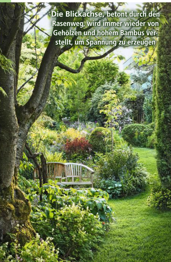
Die Blickachse, betont durch den Rasenweg, wird immer wieder von Gehölzen und hohem Bambus verstellt, um Spannung zu erzeugen

Ein verschlungener Rasenweg gibt in dem lang gezogenen Hanggrundstück (nur ca. 13 Meter breit, aber 64 Meter lang) die Form vor und führt zu lauschigen Sitz- und Leseecken, vorbei an artenreichen, üppigen und teils wild anmutenden Staudenpflanzungen. Klassische Buchsbäume und ein straff aufrecht geschnittener Wacholder geben dem Refugium auch im Winter Struktur. Wie der Rasenteppich sind die Immergrünen optische Ruhepole. Dazwischen dürfen sich die Pflanzen lebendig und dynamisch entwickeln, sodass sich der Garten in stetigem Wandel befindet.