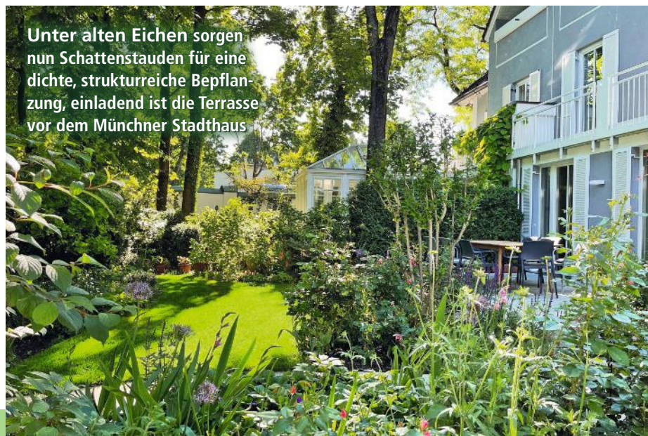
Unter alten Eichen sorgen nun Schattenstauden für eine dichte, strukturreiche Bepflanzung, einladend ist die Terrasse vor dem Münchner Stadthaus

„ Man darf nicht glauben , dass im Schatten nichts wächst. Man muss nur die richtigen Stauden auswählen und die Schattenbeete abwechslungsreich gestalten“, erklärt Martin Oelkers. Gepflanzt wurden zum Beispiel Immergrüner Filigranfarn, Elfenblume, Lilientrauben oder Funkien – elegant eingebunden in eine gelungene Wegeführung und ergänzt von einer großzügigen Terrasse und einer überdachten Lounge.